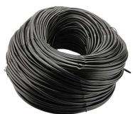
Immagine Codice Prodotto Diametro Interno mm Confezione m