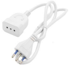
Immagine Codice Prodotto Colore Lung. Cavo cm