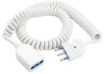
Immagine Codice Prodotto Colore Lung. Cavo cm Lung. Spirale chiusa cm