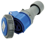
Immagine Codice Prodotto Poli Amp. Volt. Grado Protez.