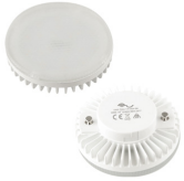
Immagine Codice Prodotto Colore Luce Im Temp. Colore