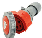
Immagine Codice Prodotto Poli Amp. Volt. Grado Protez.