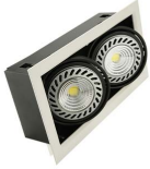
Immagine Codice Prodotto Colore Luce Im Temp. Colore